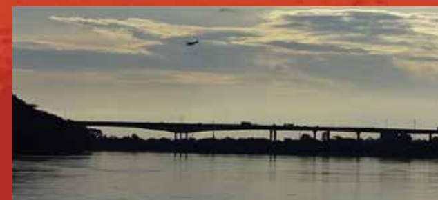
Rio Tocantins.

O município de Imperatriz, cuja sede municipal está localizada próximo à margem direita do rio Tocantins, está situado na bacia hidrográfica desse rio. Este nasce no planalto goiano, a aproximadamente 1.000 m de altitude, e é formado pelos rios das Almas e Maranhão, cujo curso mede cerca de 1.960 km até a sua foz no oceano Atlântico.