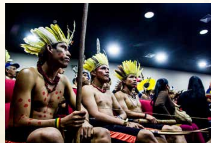
Povo Kaingang.

Motivado pela cultura Kaingang, etnia originária da região, acredita-se que as Cataratas surgiram em razão da fúria do deus M'boi, uma serpente filha do deus indígena Tupã. Prometida como presente a ele, Naipi - a bela e inteligente filha do cacique - fugiu ao lado de seu amado Tarobá. O momento da fuga foi flagrado pela poderosa serpente, que mergulhou furiosamente nas águas, formando as Cataratas.