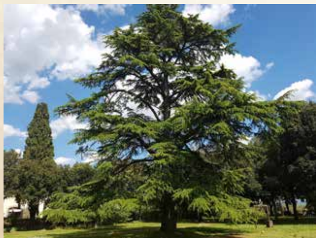
Árvore de cedro. Domínio público. Fonte: https://pxhere.com .