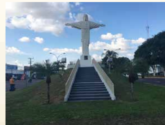
Estátua do Cristo Redentor

A cidade de Presidente Prudente é conhecida pelos eventos ligados ao agronegócio, como o Congresso Brasileiro do Cavalo Quarto de Milha, o Rodeio dos Campeões e o Agrishow. Presidente Prudente também possui museus — como o Museu & Arquivo Histórico Municipal — e outros espaços culturais, além de praças e parques arborizados, que são os principais pontos de encontro de moradores e turistas. Dentre eles, o mais concorrido é a Cidade da Criança, com seus lagos, matas e bosques, onde é possível encontrar pássaros, macacos, cotias, tatus e outras espécies da fauna local.