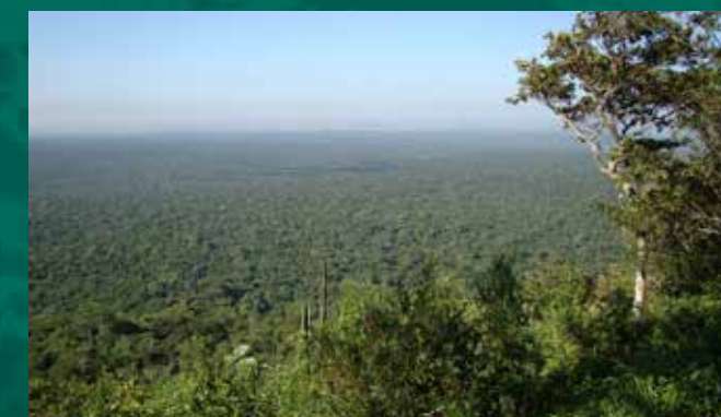
Parque Estadual Morro do Diabo

Para conhecer melhor a fauna da região, vale destacar o Parque Nacional da Serra do Diabo - localizado a 127,8 km da cidade de Presidente Prudente, com mais de 33 mil hectares de extensão - que preserva o maior remanescente de Mata Atlântica do Oeste Paulista. Segundo estimativas, há cerca de 20 onças-pintadas, 30 onças-pardas e 250 antas, populações pequenas demais para manter ecologicamente as espécies a longo prazo, além de 285 espécies de aves, algumas consideradas criticamente em perigo, como a arara-canindé, arara-vermelha e o gavião-de-penacho.