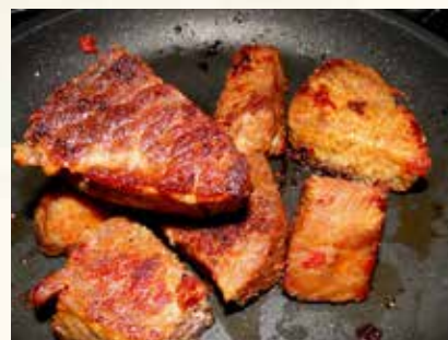
Carne de sol.