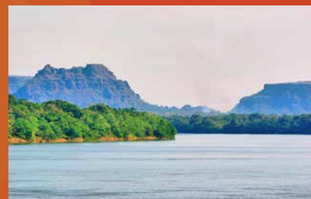
Rio Tocantins - Divisa Natural entre o Maranhão e o Tocantins.

Situada em um domínio planáltico, o oeste de Palmas é caracterizado por feições rebaixadas, notadamente planícies, em função da presença do Rio Tocantins. A maior parte do terreno onde se situa o município é plana ou suavemente ondulada, enquanto a leste é possível observar feições de maior altitude e mais acidentadas, como a Serra de Lajeado, a poucos quilômetros da capital.