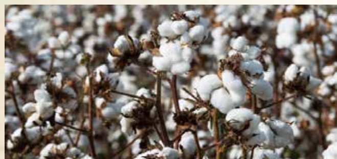
Produção de algodão.