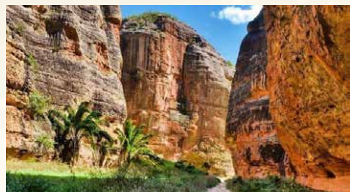
Cânions do Viana.

Em Bom Jesus, a atração ecoturística de maior impacto são os Cânions do Viana, que fazem parte dos ambientes do Parque Nacional Serra das Confusões, a maior área preservada do bioma Caatinga no Brasil. Lá, é possível observar a flora e a fauna da Caatinga no passeio, acompanhando os paredões rochosos do cânion.