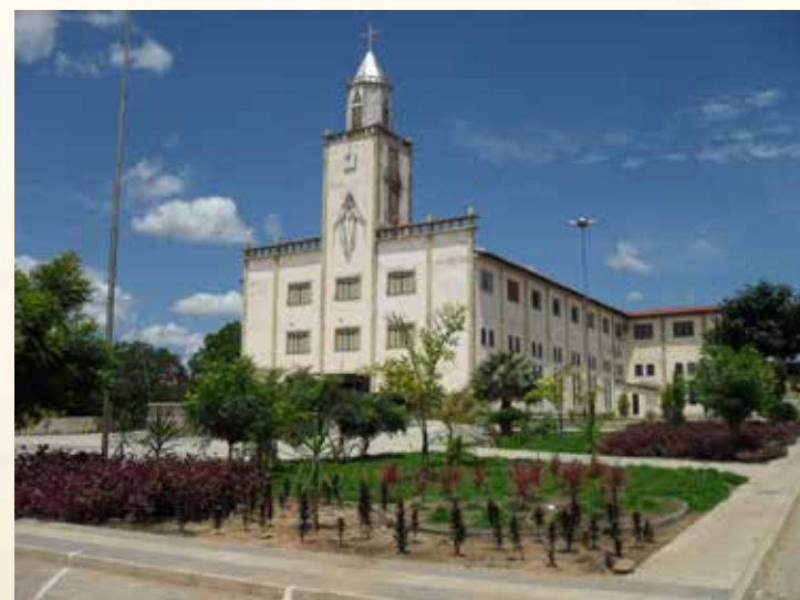
Catedral diocesana de Bom Jesus.

As primeiras habitações em Buritizinho, hoje cidade de Bom Jesus, datam do século XVIII, dando ao Município a condição de um dos mais antigos centros de povoamento do Estado do Piauí. No começo do século XIX, segundo a tradição, um preto velho, cujo nome a história não revela, fez uma capela de palha para festejar Bom Jesus da Boa Sentença, doando uma posse de terra para a formação do patrimônio. As festividades religiosas atraíram grande número de romeiros, desenvolvendo o comércio. Várias famílias foram para a região, formando, então, um núcleo populacional.