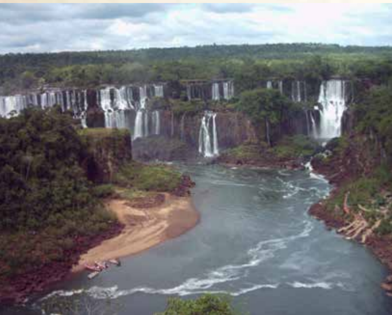
Cataratas do Iguaçu.

A região comporta a maior e mais importante área de Floresta Estacional Semidecidual do Brasil. Nela, observa-se uma exuberância de tipos vegetais, com mais de 700 espécies de plantas terrestres, abrangendo desde samambaias até árvores de grande porte, como a araucária.