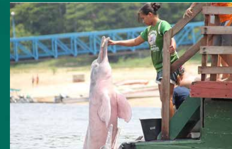
Boto-cor-de-rosa. Autoria: Renilson Silva. Fonte: Wikimedia Commons.

A região costeira apresenta clima equatorial, quente e úmido, caracterizado por um dos totais médios de precipitação mais altos do mundo: 3.300 mm anuais. O principal sistema meteorológico que causa as chuvas na Região é a Zona de Convergência Intertropical.