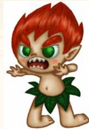
Curupira. Autoria: Iuly Hirahata Nakao. Fonte: https://flickr.com .