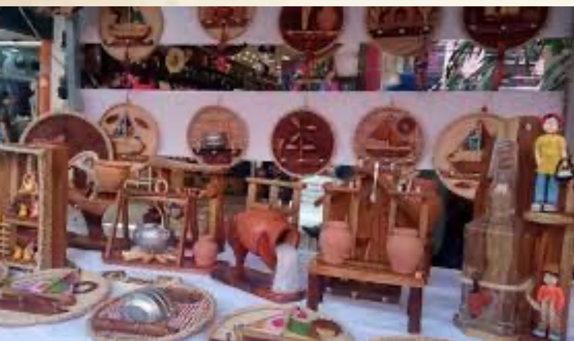
Feira de artesanato.

O artesanato indígena, principalmente o krikati é muito comum na cidade. Na produção indígena se destaca a cerâmica, adornos, objetos em palha, barro e tecelagem. Também se destaca o artesanato rural como arreio, berrante e agroprodutos.