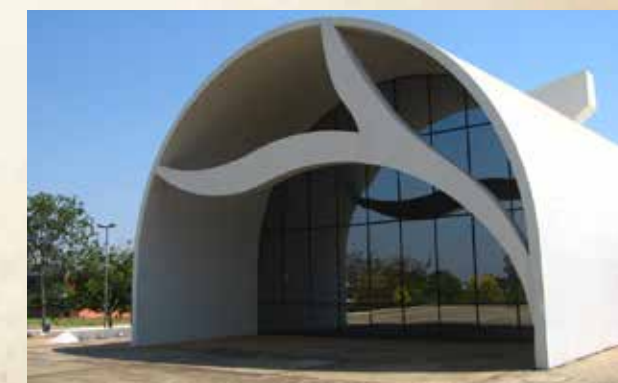
Memorial Coluna Prestes

O memorial Coluna Prestes é um dos mais famosos pontos turísticos de Palmas e foi criado pelo arquiteto Oscar Niemeyer. O Espaço Cultural agrega o que há de melhor em cultura, artes e entretenimento. O Theatro Fernanda Montenegro é palco das principais peças e espetáculos da cena artística regional e nacional. O Cine Cultura é o mais rico espaço para a cena cult do audiovisual e para as produções nacionais. Há ainda o NILA (biblioteca e galeria de artes). A cidade de Palmas também é conhecida como o "Umbigo do Brasil" já que seu marco zero é o ponto mais central do país.