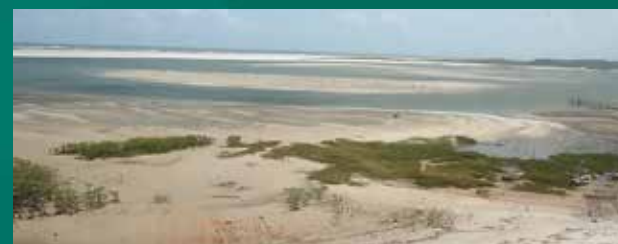
Praia em Salinópolis.

Na cidade de Salinópolis, encontram-se áreas de planície que correspondem à faixa de sedimentos argilosos e arenosos, resultantes das ações dos ventos, ondas e marés. Já as áreas de planalto condizem com a superfície estruturada em relevo degradado, com topos levemente ondulados, perfis convexos e vertentes suaves.