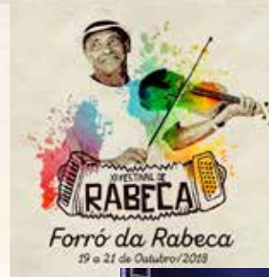
Mestres rabequeiros e a Orquestra de Rabecas de Bom Jesus.