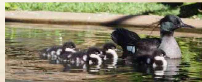
Pato-mergulhão ( Mergus octosetaceus ), é um dos animais mais emblemáticos e raros do Cerrado.

No final do século XIX e no decorrer do século XX, a ideia de criar o Tocantins, estado ou território, esteve inserida no contexto das discussões apresentadas em torno da redivisão territorial do país, no plano nacional. Mas a concretização dessa ideia só veio com a Constituição de 1988 que desmembrou o estado de Goiás. No dia 5 de outubro de 1989, foi promulgada a primeira Constituição do Estado, feita nos moldes da Constituição Federal. Em 1º de janeiro de 1990, foi instalada a capital Palmas, no centro geográfico do estado.