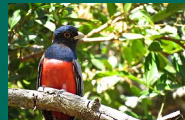
Surucuá-de-barriga-vermelha. Autoria: Samuel Campelo. Fonte: Wikimedia Commons.

Localizada a 635 km da capital Teresina, a cidade está em uma zona de transição entre o bioma Cerrado e a Caatinga. Dentre as espécies nativas de mamíferos, encontra-se o gato-do-mato-pequeno, o gato-maracujá, o gato-palheiro, a jaguatirica, a onça-pintada, o peixe-boi-marinho, o tamanduá-bandeira, o tatu-bola, o tatu-canastra, o lobo-guará, o macaco-prego e o bicho-preguiça. Entre as aves, destaca-se a surucuá-de-barriga-vermelha, ave-símbolo do estado do Piauí. As espécies de répteis mais comuns são a jararaca e a cascavel.