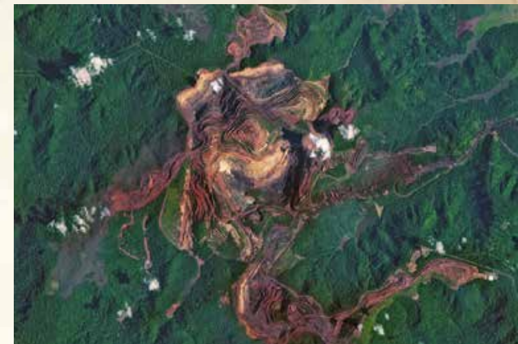
Minas na Serra dos Carajás.

Entre os animais ameaçados de extinção estão o gato-do-mato, o mutum-de-penacho, o gato-maracajá, o tamanduá-bandeira, a onça-parda e a águia-cinzenta.