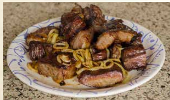
Carne de sol.

Alguns pratos típicos do Piauí que podem ser degustados em Bom Jesus são a carne de sol e a paçoca salgada. Outros pratos dignos de nota são: Maria Isabel, mistura de arroz com pedaços de carne, temperado com cheiro verde entre outros ingredientes; bode assado ou cozido, preparado com leite de coco; panelada, feita de partes do intestino do boi cozinhadas com bastante tempero e muito apreciada com farinha e pimenta.