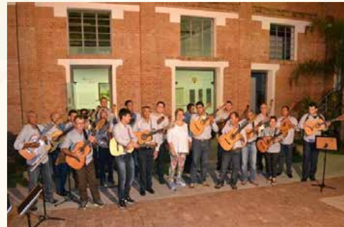
Orquestra Municipal de Viola de Presidente Prudente.

O município também organiza o Festival Literário de Presidente Prudente (FLITPP) e o Festival Nacional de Teatro.