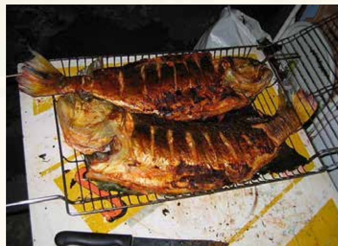
Dourado assado.