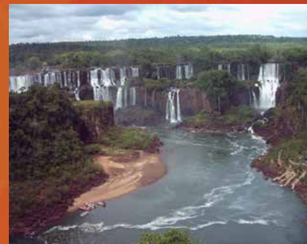
Cataratas do Iguaçu. Autoria: Antonio Fernandes. Fonte: https://flickr.com .

A paisagem na rodovia BR-277, entre Cascavel e Foz do Iguaçu, é um ótimo exemplo do relevo nesta região: quase plano, com leves ondulações. Essa suavidade é quebrada, justamente, pelas cataratas. A força das águas do rio Iguaçu escavou as rochas vulcânicas, criando um cenário impressionante.