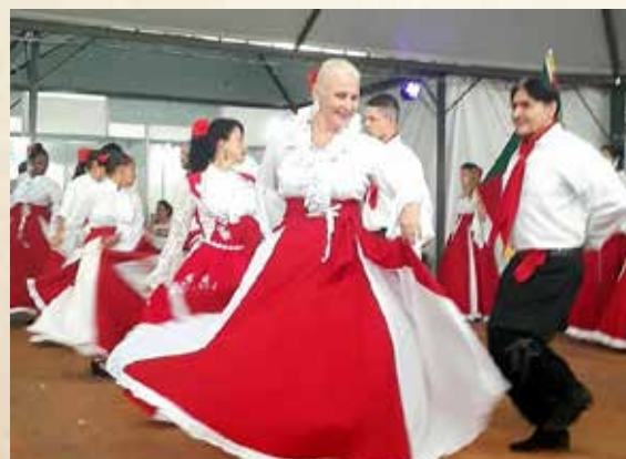
Grupo de danças gaúchas Telêmaco Borba. Autoria: Simplus Menegati. Fonte: Wikimedia Commons.

A região da tríplice fronteira possui uma cultura muito variada devido à diversidade de povos que a habitam, reunindo elementos brasileiros, argentinos e paraguaios. Destacam-se os Centros de Tradição Gaúcha (CTG), que preservam a cultura regional, principalmente a dança. As danças gaúchas também marcam presença nos bailes, nos quais os casais se reúnem para o famoso "arrasta pé". Entre essas danças, estão a quadrilha, o tango, a polca paraguaia, a dança do cântaro e a chacarera.