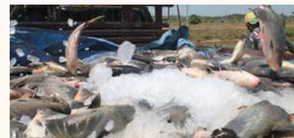
Pesca no Pará.

A pesca representa principal atividade econômica de Salinópolis, visto que movimentando o comércio local e envolve um grande contingente de pessoas. É praticada em sua totalidade de forma artesanal, explora uma grande variedade de espécies e abastece, principalmente, o mercado local e regional. O turismo também é uma atividade econômica importante, visto que a cidade possui praias belíssimas, uma orla de 2 km de extensão, o farol da cidade, belos hotéis, resorts e parques aquáticos.