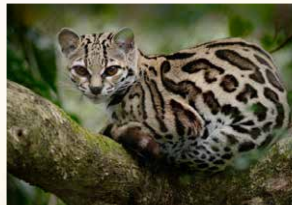
Gato Maracajá

A cidade funciona como entreposto comercial e de serviços, no qual se abastecem mercados locais em um raio de 400 km. O município também se situa na área de influência de grandes projetos, como a mineração da Serra dos Carajás, a mineração do igarapé Salobro, a Ferrovia Carajás/Itaqui, a Ferrovia Norte-Sul, as indústrias guzeiras e a indústria de papel e celulose Suzano.