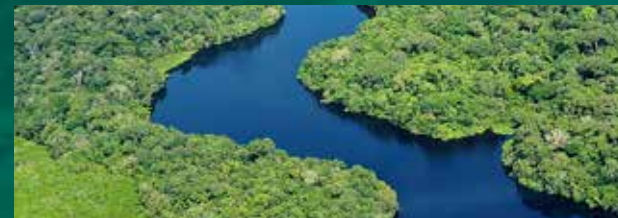
Rio Amazonas. Autoria: Chronus. Fonte: Wikimedia Commons.