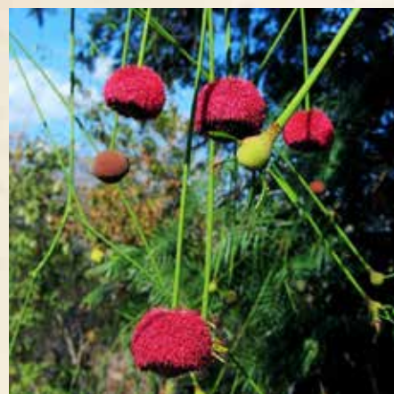
A Fava de Bolota ( Parkia platycephala ) é muito encontrada em praças e jardins do estado.