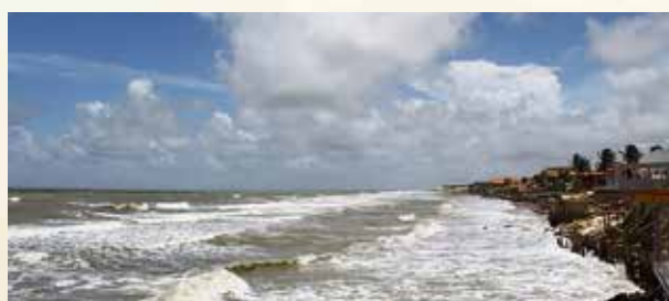
Praia do Atalaia.

Existem cerca de 40 mil espécies de plantas no bioma amazônico da região, entre elas: o guaraná, o cupuaçu a seringueira e o cacau. A seringueira destaca-se nesse grupo por fornecer o látex usado na produção da borracha, sendo, portanto, de grande valor comercial. Não podemos deixar de citar também que a Floresta Amazônica é rica em plantas com menor dimensão, como trepadeiras, cipós e plantas epífitas, além de vegetais típicos de manguezais.