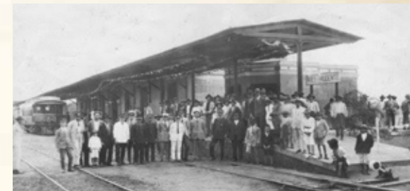
Ferrovia representou desenvolvimento para a região de Presidente Prudente