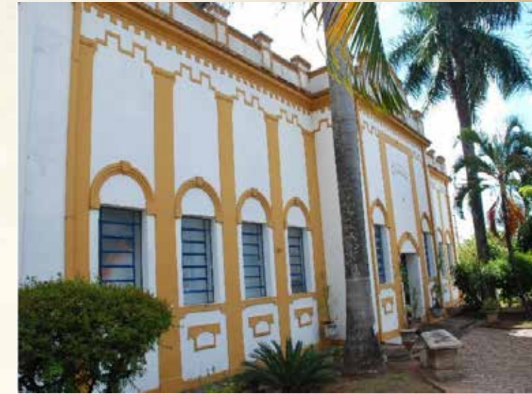
Museu e Arquivo Histórico Prefeito Antonio Sandoval Netto.