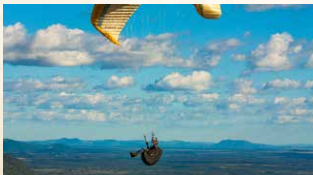
Parque Estadual do Lajeado