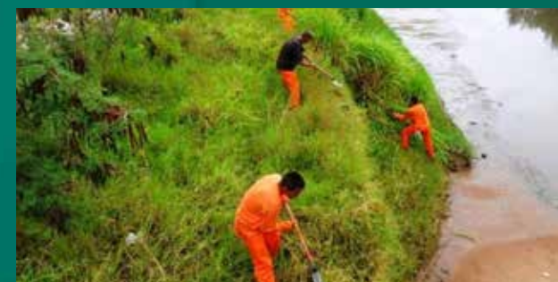
Conservação do Córrego do Veado.

Quem chega a Presidente Prudente pela SP-270, a rodovia Raposo Tavares, logo percebe o relevo da região: colinas amplas e suaves, com topos ondulados ou quase planos.