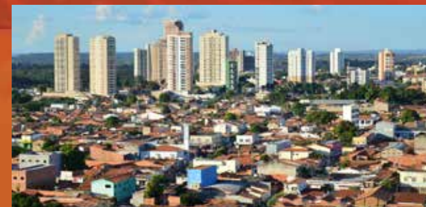
Vista aérea de Imperatriz.

O relevo da cidade de Imperatriz é formado por extensas planícies, associadas ao vale do rio que banha a região, apresentando altitude máxima de 200 metros.