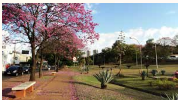
Parque do Povo. A autoria: Fernando Urbano. Fonte: https://flickr.com .