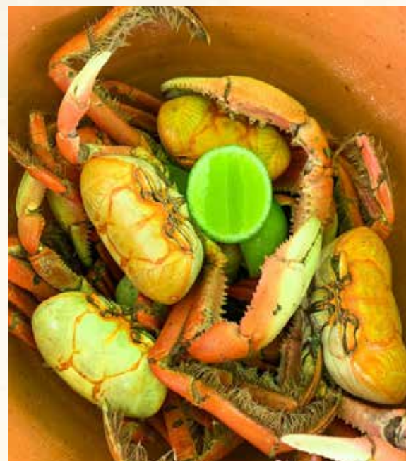
Caranguejo servido.

O carimbó é uma dança de roda típica do nordeste do Pará e, por isso, a cidade promove o Festival do Carimbó, atividade que destaca a cultura do município, com apresentações dos grupos de carimbó do município e de outras cidades vizinhas, onde essa cultura está viva em seu cotidiano. O evento acontece em três dias com apresentações de vários grupos culturais e algumas competições, como: concurso melhor composição e concurso da musa. Há também estandes de exposição e venda de comidas típicas.