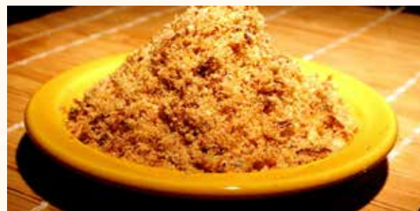
Paçoca de Carne de Sol.