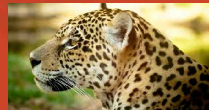
Onça-pintada. Autoria: Fábio Grison. Fonte: https://flickr.com .

O clima de Foz de Iguaçu pode ser definido como subtropical úmido, com chuvas no verão e no inverno (1.500 mm/anuais). O verão pode apresentar temperaturas acima de 30° C, ao passo que, no inverno, com a passagem de frentes frias, a temperatura pode cair para menos de 10° C.