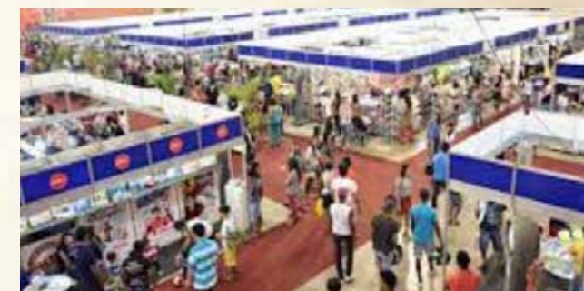
Feira literária do Maranhão em Imperatriz.