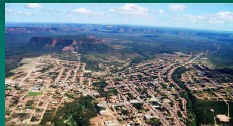
Vista aérea de Bom Jesus.