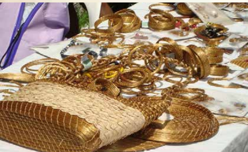
Capim dourado. Autoria: Zaíra Pires. Fonte: https://flickr.com .

Palmas, apesar de jovem, possui grande variedade artística e cultural. Um de seus artesanatos mais conhecidos é o Artesanato em Capim Dourado que tem origem indígena, entre o povo Xerente, e é reconhecido como um símbolo da cultura tocantinense.