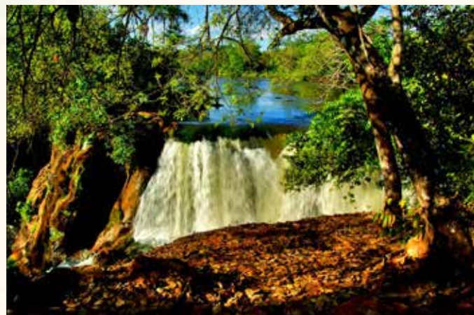
Cachoeira do Prata - Parque Nacional da Chapada das Mesas.

A região possui uma vegetação típica do bioma Cerrado, caracterizado por distribuição de diversas áreas de aspectos savânicos e florestais, onde também podem ser encontradas espécies da Caatinga e da Amazônia. Nas áreas de solo arenoso, ocorrem fisionomias de cerrado e campo sujo. Ao longo dos cursos d'água existem matas de galerias bem conservadas. Em locais com solo mais rico, principalmente em topo de serra, há manchas de matas semidecíduais, isto é, cujas árvores perdem apenas uma parte de suas folhas durante os períodos de estiagem. Podemos encontrar várias espécies com valor comercial, alvos de desmatamento ilegal, como o cedro, a aroeira, o ipê, o jatobá, dentre outros.