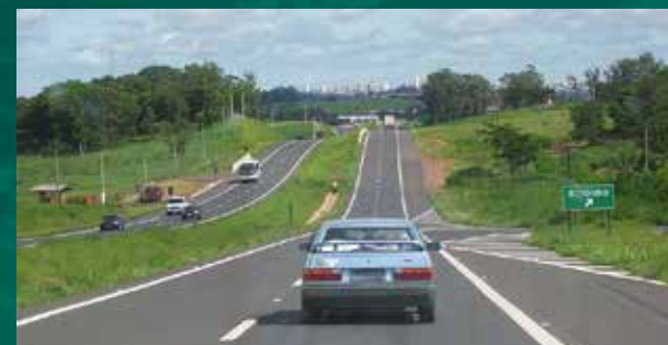
Rodovia Raposo Tavares.