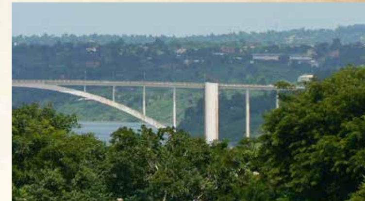
Ponte da Amizade.