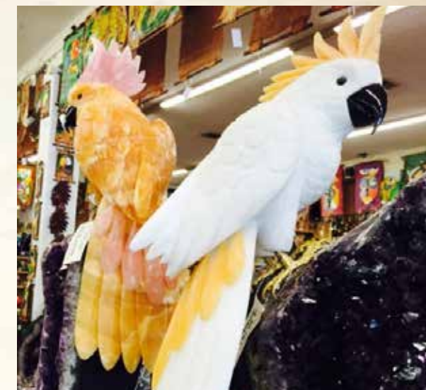
Produto da loja Artesanato & Chocolate Caseiro de Foz do Iguaçu. Autoria: Elias Roviolo. Fonte: https://flickr.com .